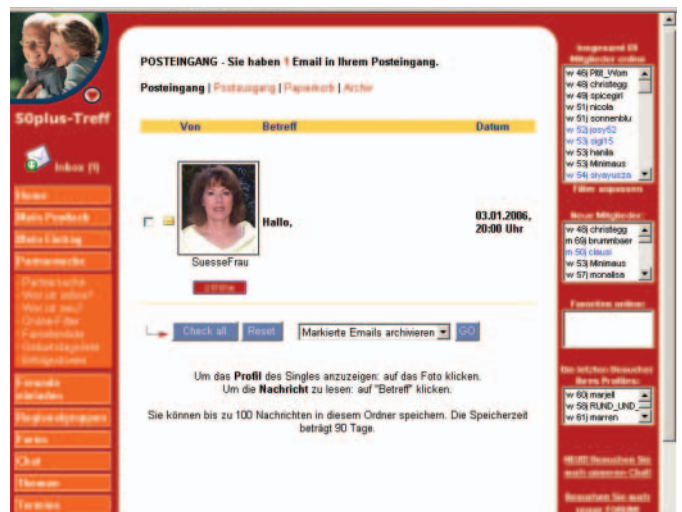
Im Posteingang findet man Nachrichten von anderen Singles, die eine Kontaktaufnahme wünschen.